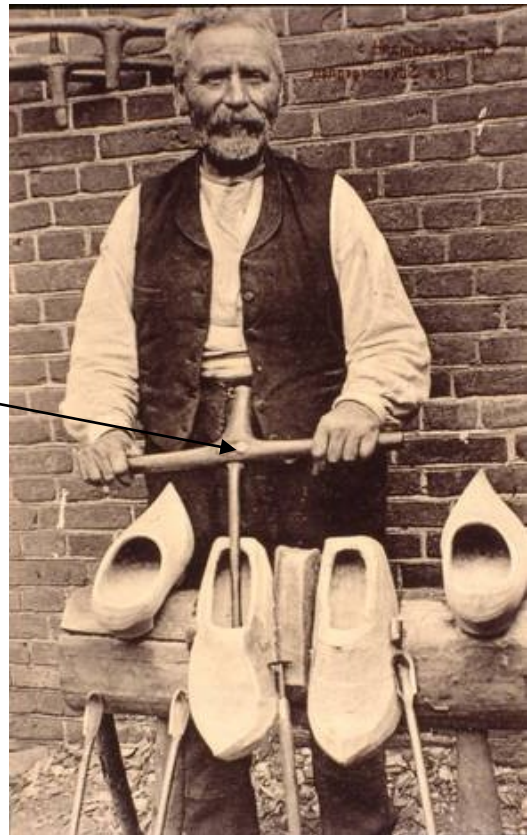
Træskomageren i færd med at udbore en spidsnæset træsko. Med et jern mægen til den der hænger på væggen på billedet til venstre.