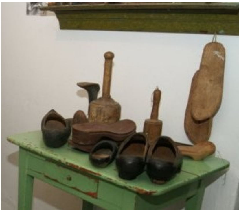
De færdige produkter, fra v. en gammeldags spidstræsko, så en industrifremstillet træskobund, og bag den det vigtige værktøj kollen. Foran en træsko i barnestørrelse, og endelig to mere moderne træsko.