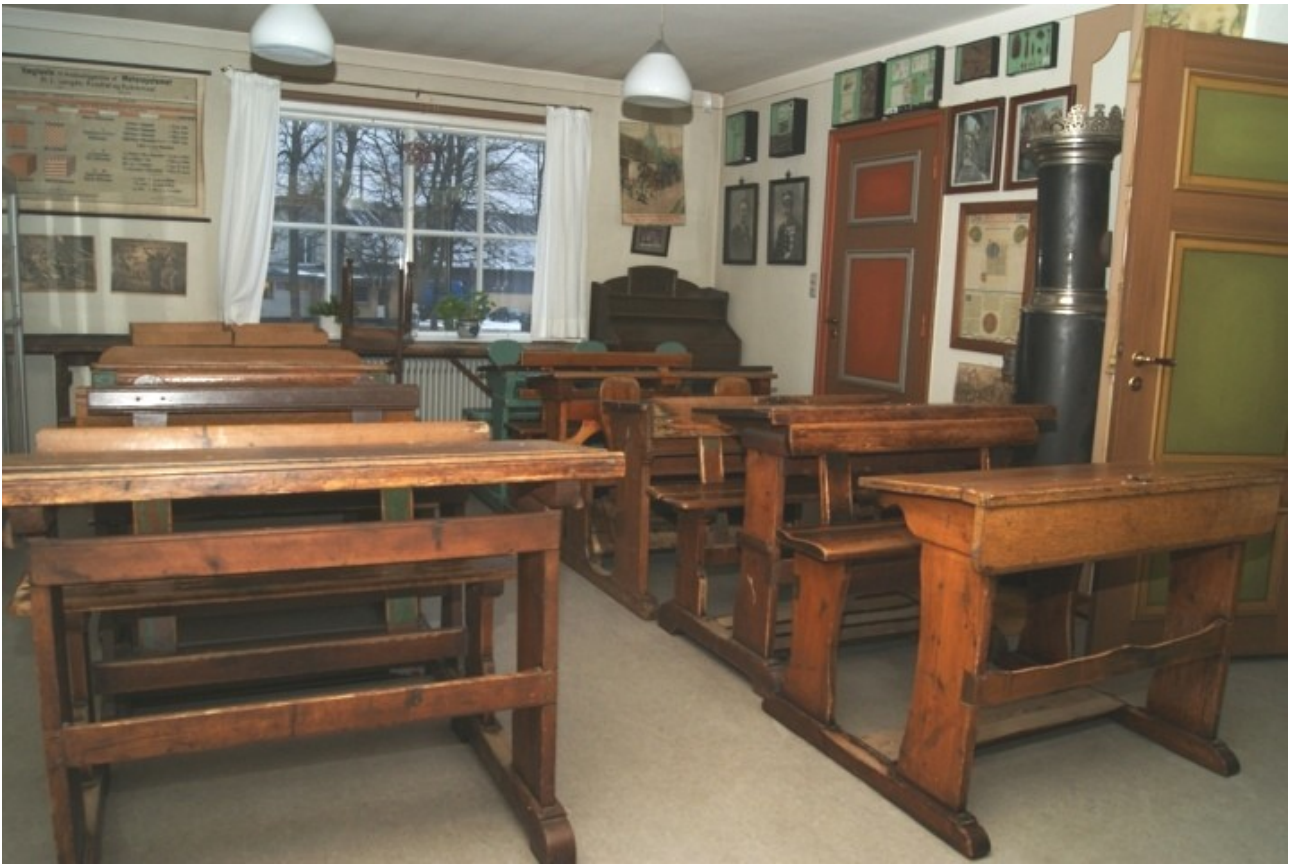
Skolebænke eller pulte, om man vil, stammer fra skolerne i Frederikshåb, Bindeballe og Almstok samt lilleskolen og den såkaldt "store skole" i Vandel. De blev alle lukket i forbindelse med oprettelsen af centralskolen i Vandel i 1962.