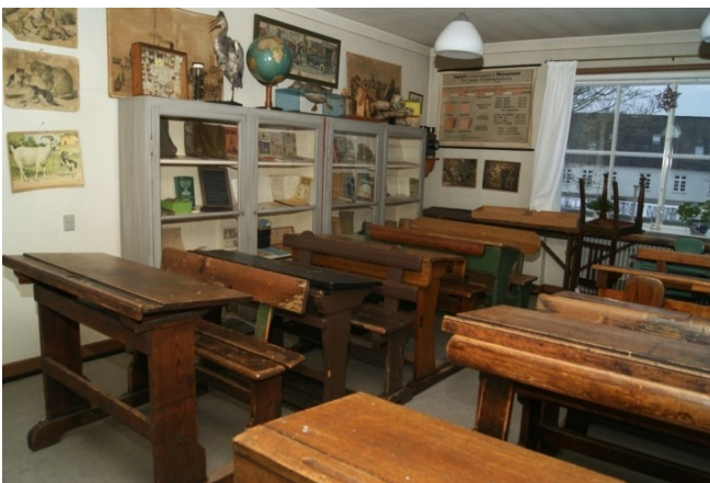
De pædagogiske hjælpemidler ses dels inde i skabene, dels ovenpå i form af bøger og udstoppede dyr og fugle. Endelig er der de informative tavler om, hvorledes man færdes i trafikken og mange andre fornuftige måder at opføre sig på.