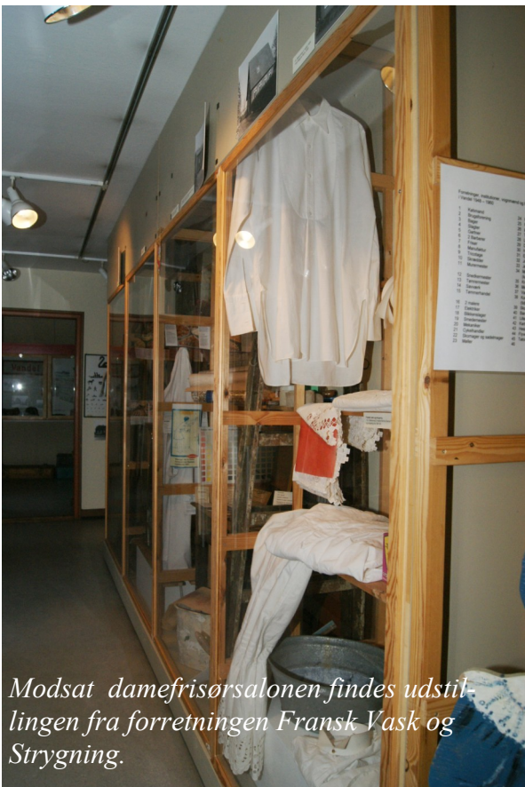
Modsat damefrisørsalonen findes udstillingen fra forretningen Fransk Vask og Strygning.