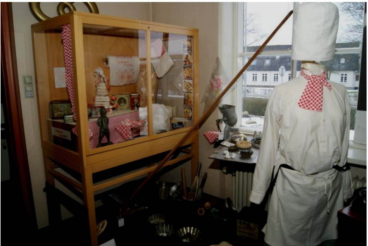
Tilbage i 1900-tallet havde Vandel både bager og konditori. Konditoriet lukkede efter 2. Verdenskrig, tilbage var kun bageriet, som lukkede for mere end 25 år siden.