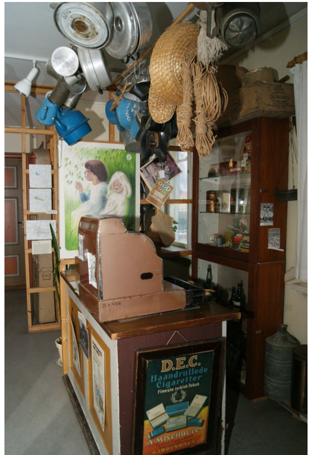
Vandel Brugsforening eller Dagli'Brugsen, som den hedder i dag, eksisterer stadig men blev flyttet og moderniseret i 2003.