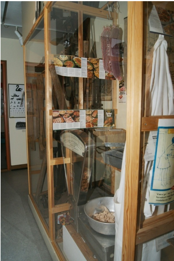
Herefter følger byens slagterbutik, som lukkede for adskillige år siden.