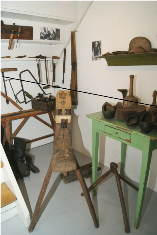
Træskomagerens værksted med det værktøj, der skulle til for at lave en træsko.