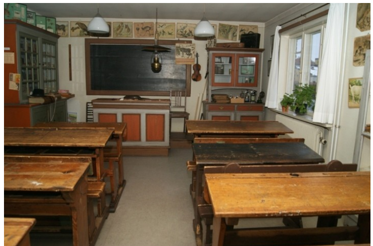
Skolestuen set fra elevernes plads. Læreren sad på sin forhøjning og så, bogstavelig talt, ned på sine lever. Violinen hængte på sin plads ved siden af ferlen, et afstraffelsesinstrument, sammen med spanskrøret og riset. Et efter tiden meget veludstyret klasseværelse. Sådan så virkeligheden ikke ud i Randbøl Sogn før 1950.