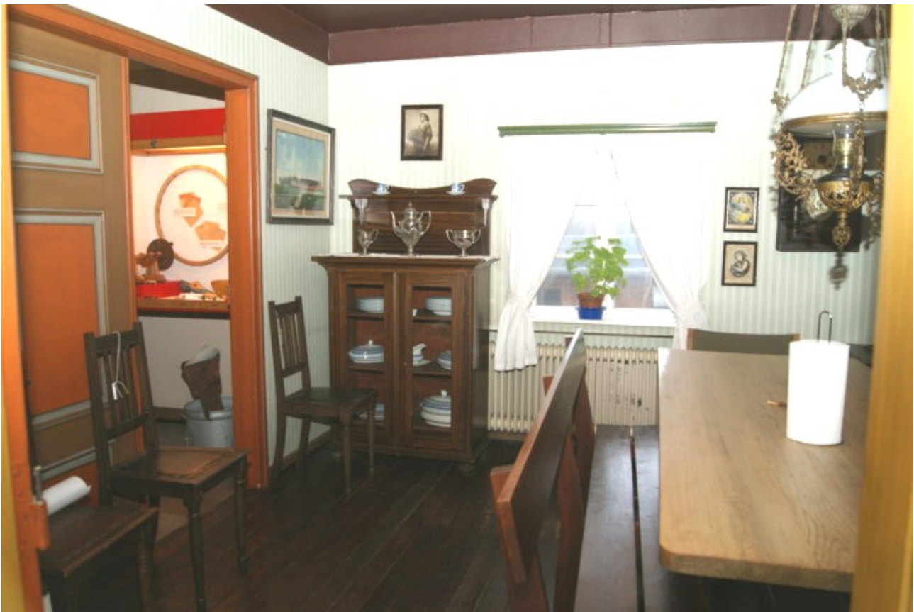
"Bondestuen" - det er her, eleverne klipper julepynt. I hverdagen er det her, museets frivillige drikker deres eftermiddagskaffe om torsdagen, når man mødes for at holde museet i drift.