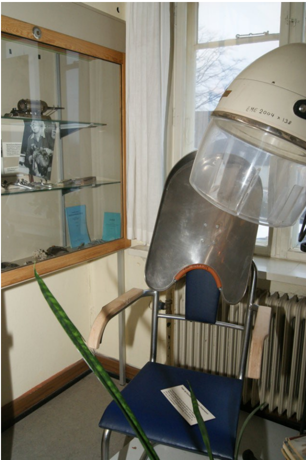
Inventaret fra byens tidligere damefrisørsalon, med den umage stol og den larmende tørrehjelm. Her led byens kvinder for skønheden.