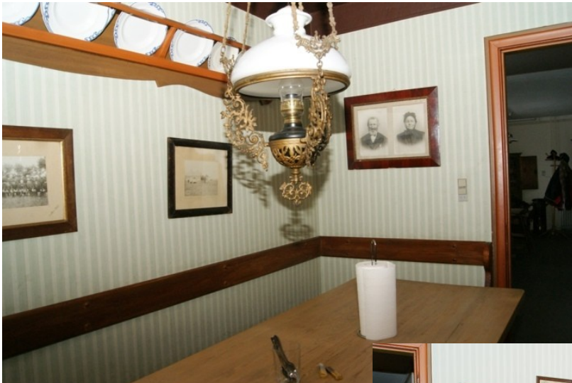
Detaljen i dette billede er petroleumslampen, som ikke er bygget om til elpærer, men som aldrig bruges.

Det skal indrømmes, at der ikke kan fyres i bilæggerovnen. Fyringen skal ske fra det modsatte rum, og det lader sig ikke gøre, for der står komfuret.