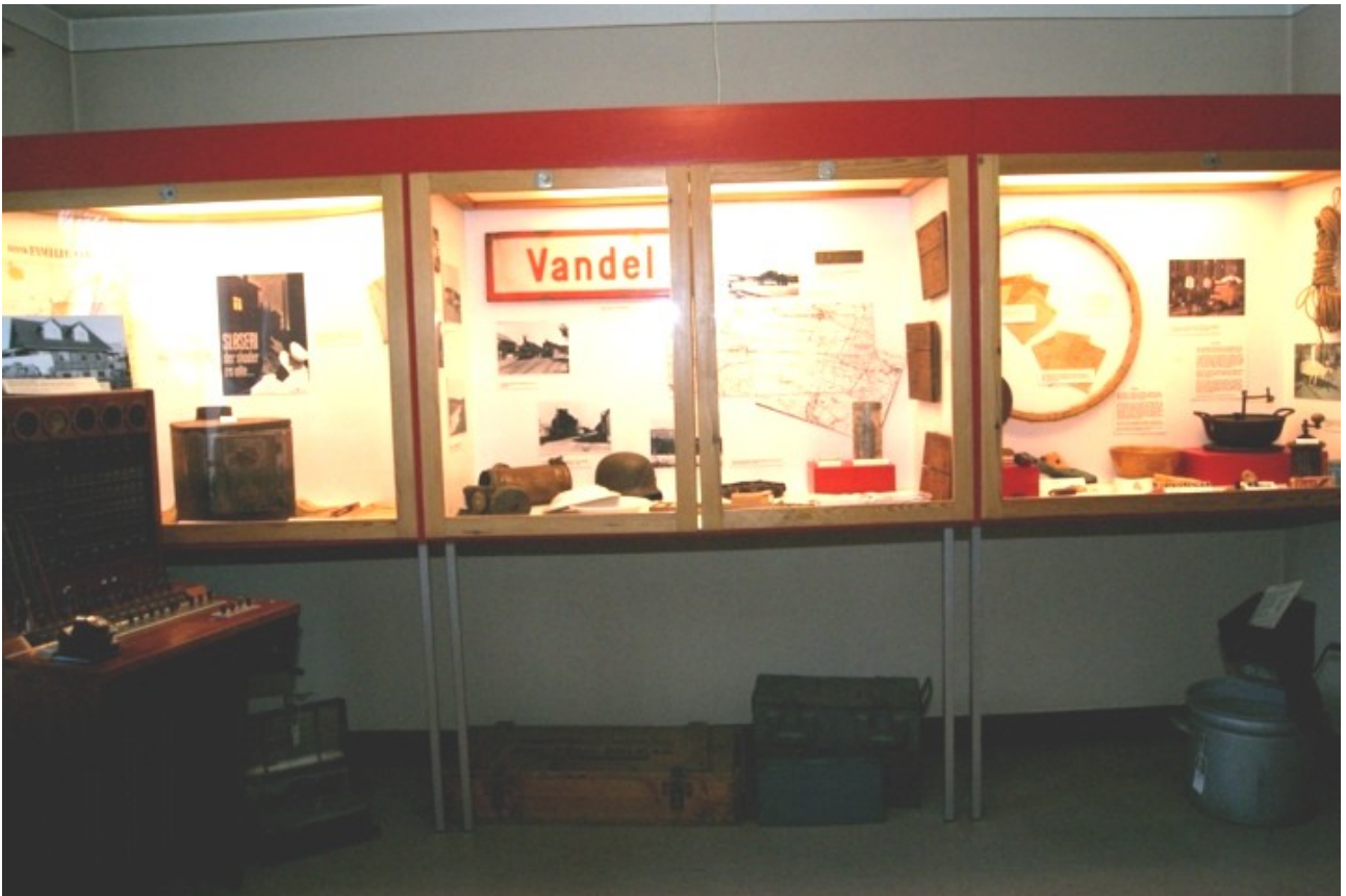
Fra venstre ses omstillingsbordet fra Flyvestation Vandel, et magen til fandtes i Vandel telefon-central indtil 1958. I monterne er der udstilling af genstande fra besættelsestiden 1940-45.