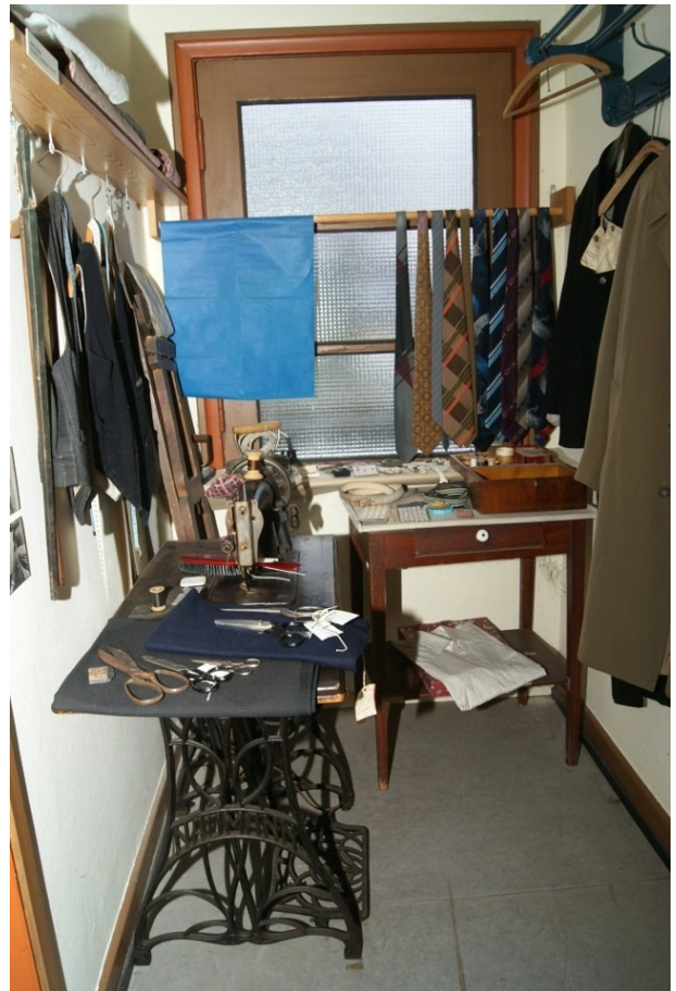
Lidt længere fremme det for længst lukkede skrædderværksted.