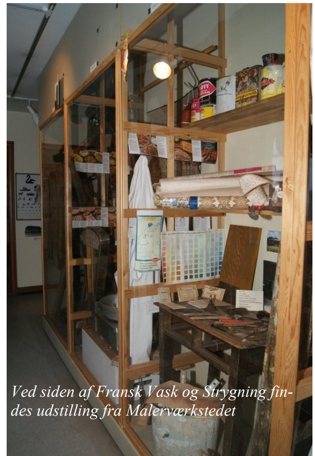
Ved siden af Fransk Vask og Strygning findes udstilling fra Malerværkstedet