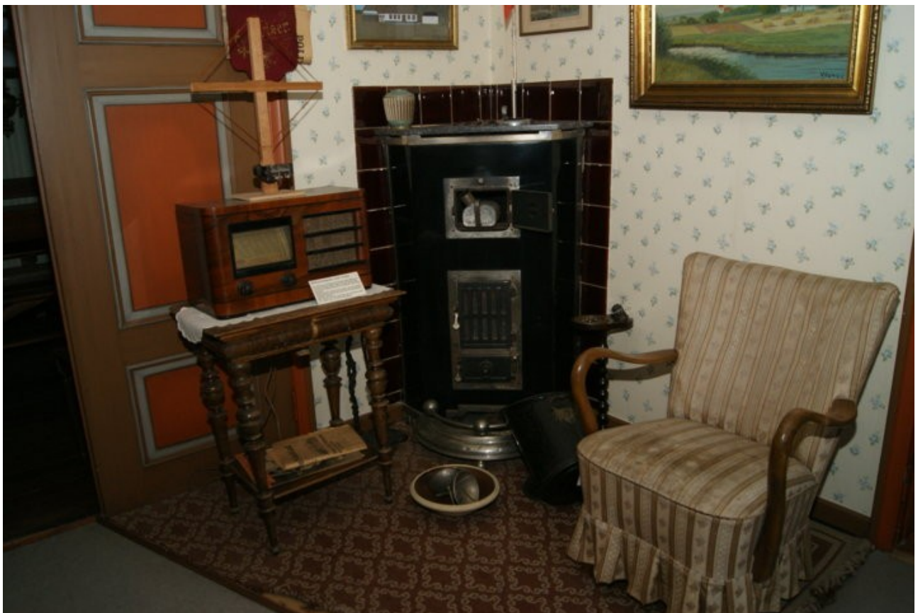
Et hjørne af en dagligstue, som den så ud under den tyske besættelse af Danmark fra 9. april 1940 til 5. maj 1945.