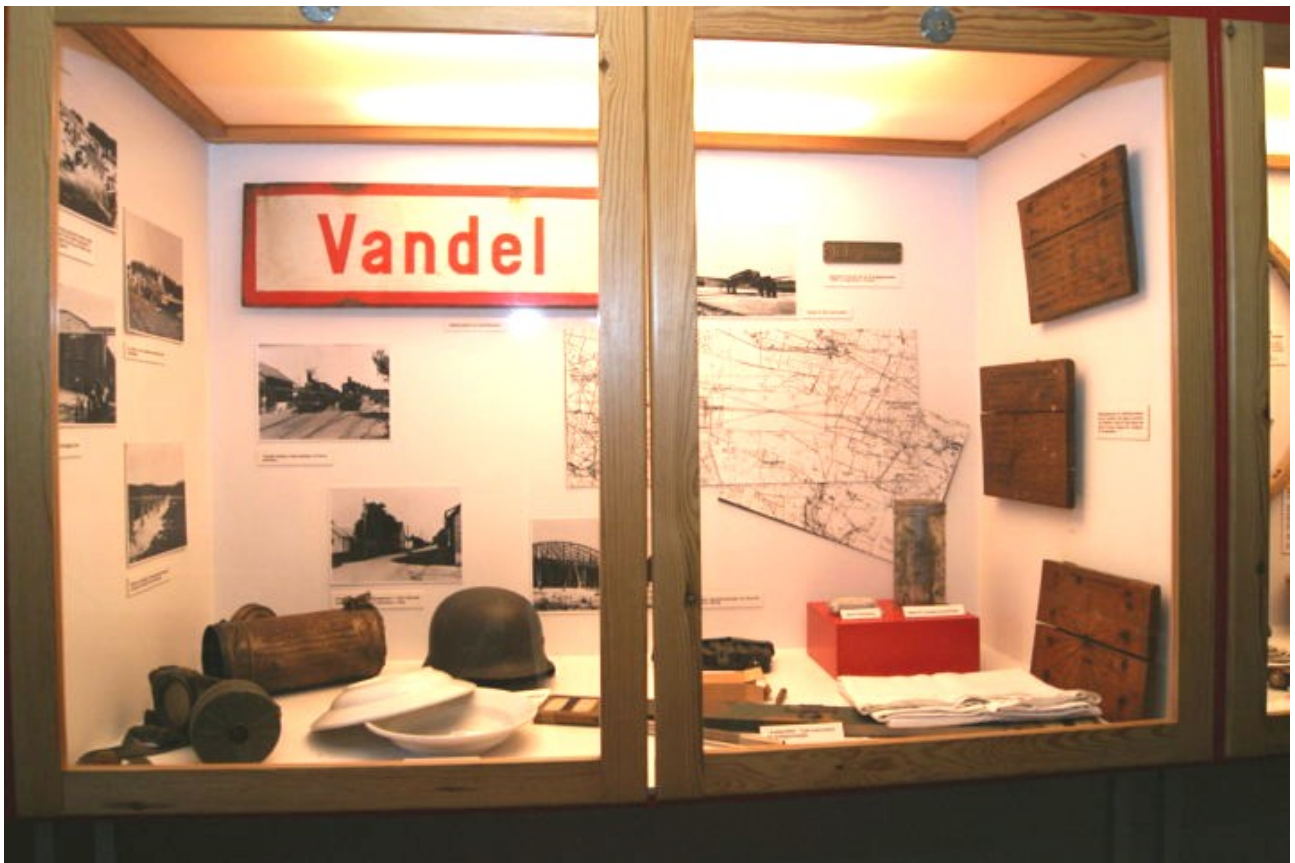
Udstillingen rummer genstande fra dengang Luftwaffe byggede en flyveplads syd for Vandel by. Skiltet med bynavnet stammer fra Vandel Station.